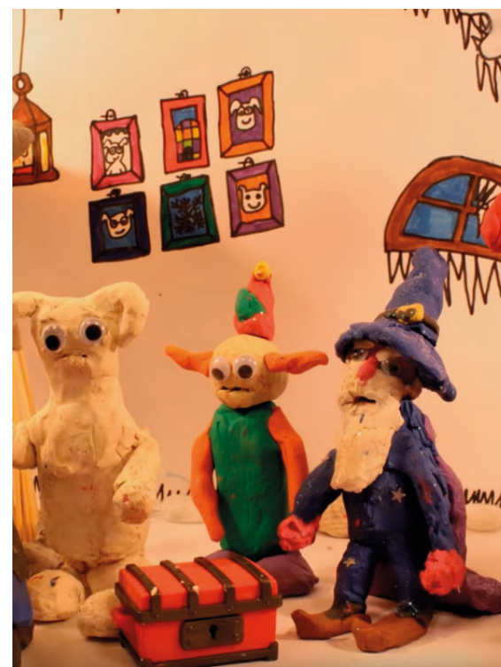
„Der Schatz der Monster“ unser Trickfilm auf YouTube